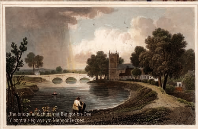
The bridge and church at Bangor-on-Dee Y bont a'r eglwys ym Bangor Is-coed