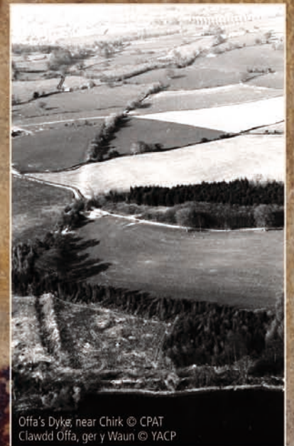
Offa's Dyke, near Chirk Clawdd Offa, ger y Waun